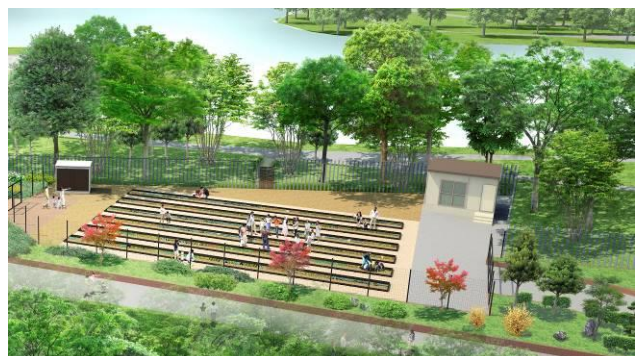
<食の体験研修施設>