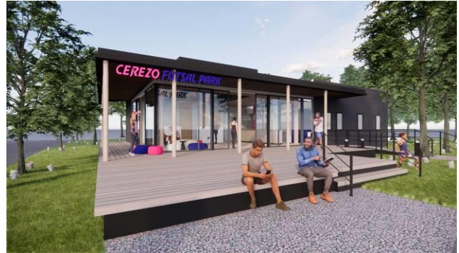
<フットサルコート管理棟>