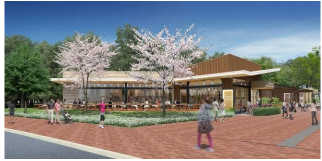
<ヤンマー直営レストラン>