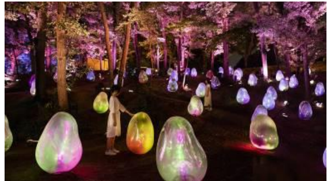
<チームラボ作品イメージ>

《呼応する小宇宙 - 液化された光の色, Sunrise and Sunset》